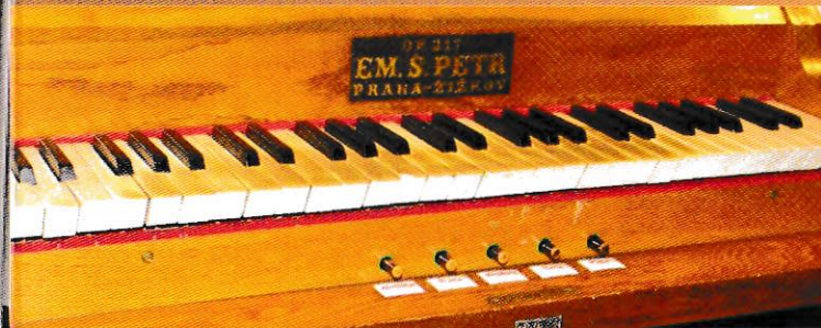
opotřebovaná stoletá klaviatura