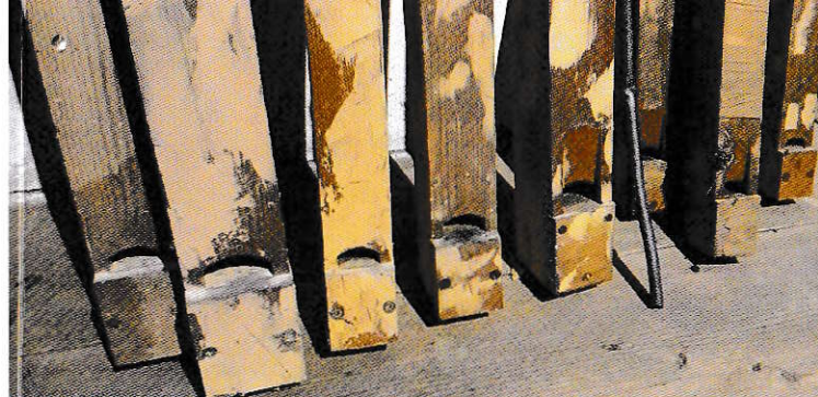
důsledky starších provizorních oprav