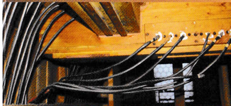
poškození traktury a pneumatických rozvodů