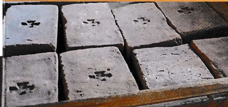
zátěžové cihly z panství maltézských rytířů